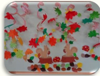
セレクトメニュー