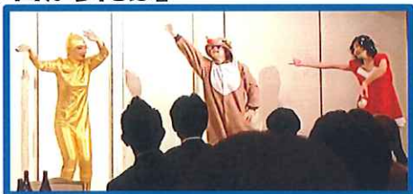
パプリカと愉快的仲間達