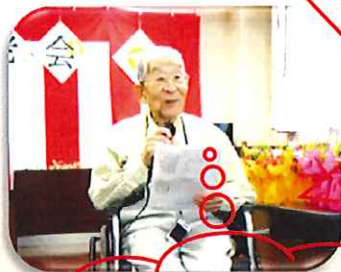
入居者様代表！ お祝いのお言葉頂きました。

9/16 敬老会 フラダンス・ボランティアの皆様にて発表して頂き、 敬老の日のお祝いをしました。