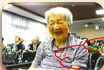
おめでとうございます！