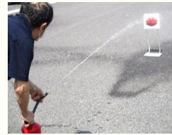
2年ぶりに行った事も有り、どのゲームも盛り上がり楽しまれました。