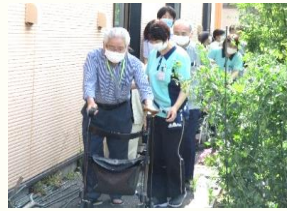
避難訓練・消火訓練どちらも積極的に参加して頂きました。