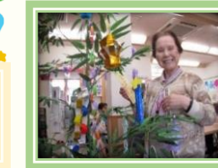
七夕で短冊に願いを込めてお願い事を書きました。皆さんで笹に飾りや短冊を飾って、

男性の皆様のためにカレーを作りましょう！ということで、女性利用者様に父の日イベントとしてカレーを作っていました。