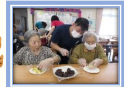
6月和菓子屋さん銘菓「あゆ焼き」が並ぶ頃、施設でも「あゆ焼き」を手作りしました。