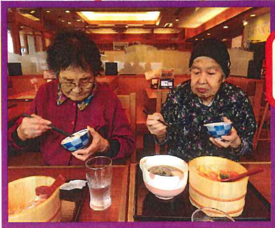
行事活動 【外食ツアー】